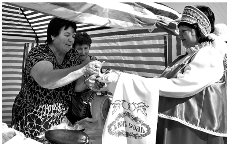
Дорогих гостей хлебом-солью встречаем!