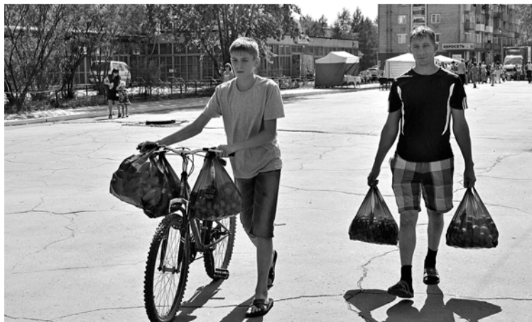
Никто не ушёл в этот день с пустыми руками...