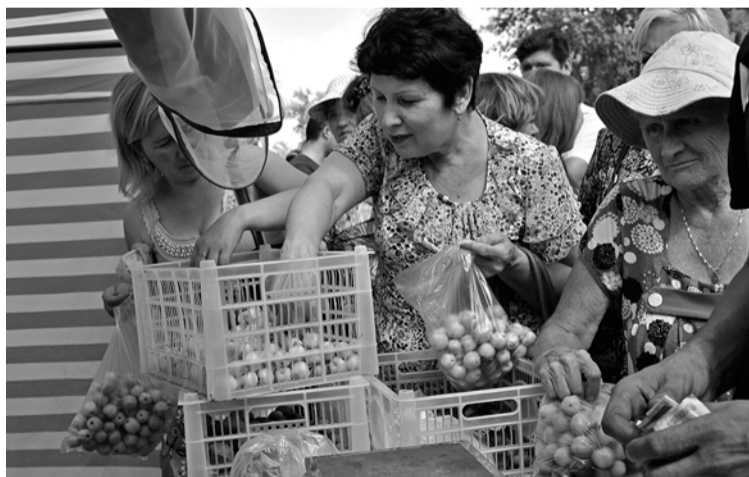
А душистый ранет – нарахват!