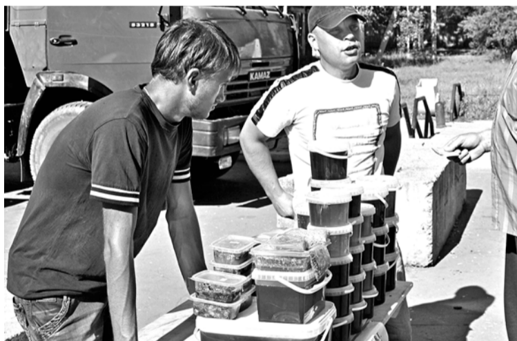
Особым спросом пользовался завитинский медок.