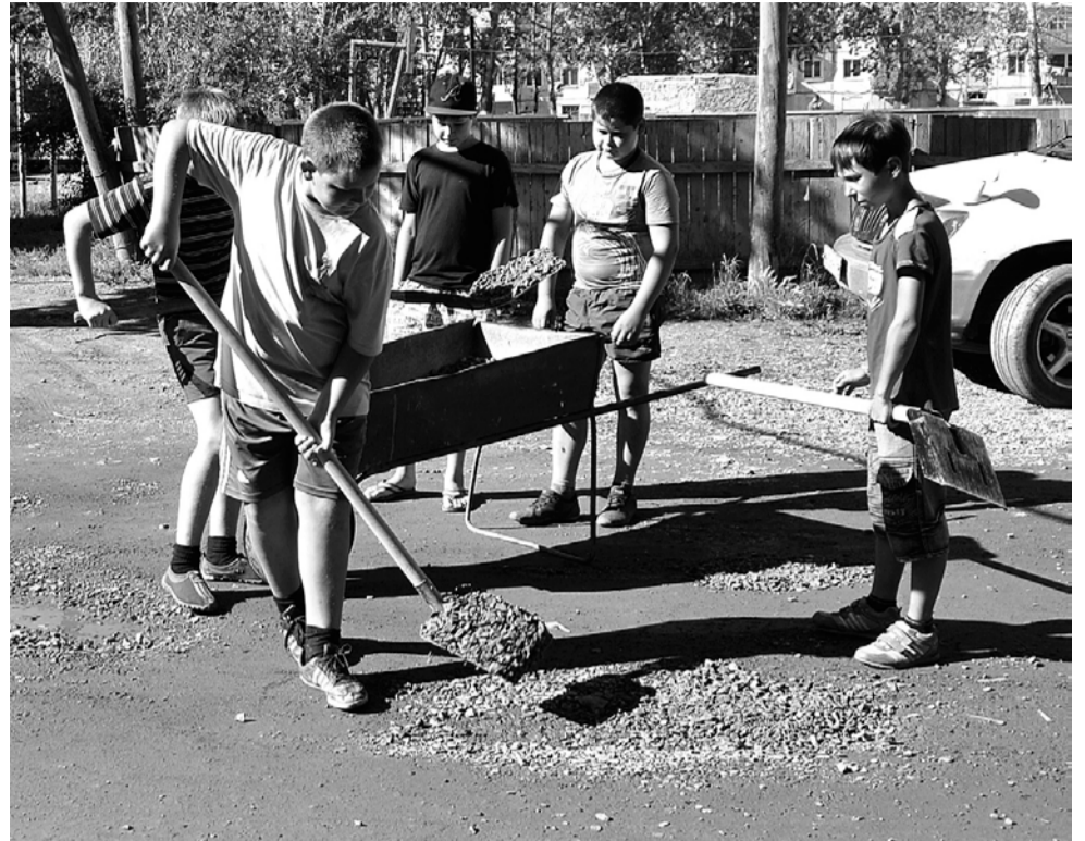
Кто-то за лето сумел и подзаработать на благоустройстве дворов и улиц.