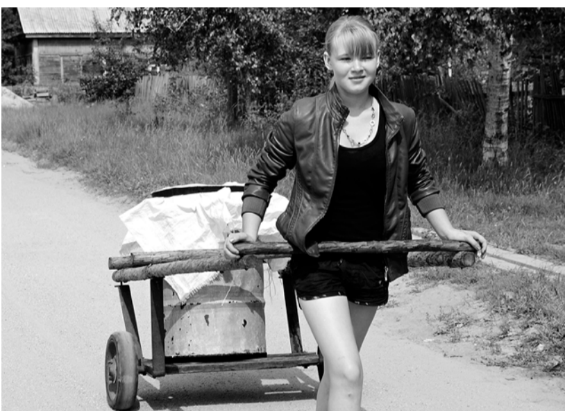
В деревенском хозяйстве много дел: в огороде потрудиться, привезти водицы....

Погода последнее время всё более непредсказуема. Переходы с зимы на весну, а с весны на лето бывают так коротки, что порой мы из тёплых курток «перепрыгиваем» сразу в шорты, платья и футболки. Ну нет стабильности погодных условий! Не успели оглянуться, а на дворе уже август, «порадовавший» нас дождливыми прогнозами, градом и ураганами, срывающими крыши домов, проливными дождями и затопленными улицами и дворами, ставшими нормой амурского лета. И... жаркой, солнечной погодой. Ещё в апреле столбик термометра побил первый рекорд, «добежав» до отметки +30, и это в тени! На солнце температура была за сорок. А от июньского зноя было одно спасение – фонтаны и природные водоёмы. Что ни говори, а нынешнее лето баловало амурчан солнцем и теплом. Таким оно и останется в памяти и на фотографиях – жарким, солнечным и радостным.