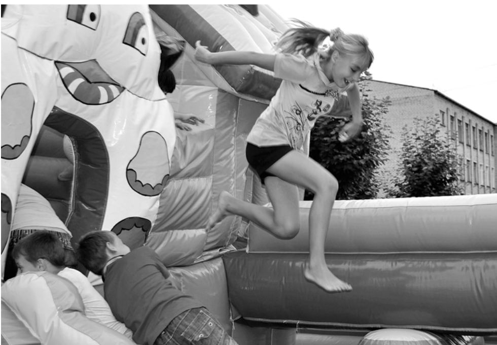
Ура! Ликует детвора. В батуте ноги, руки, смех, а я прыгну лучше всех.