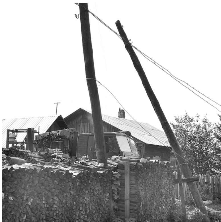
На Рабочей, 3 электрический столб лежит прямо на дровах.