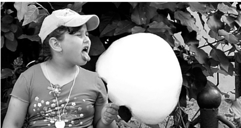
В летний зной я в тень присела, вату сладкую поела...

Погода последнее время всё более непредсказуема. Переходы с зимы на весну, а с весны на лето бывают так коротки, что порой мы из тёплых курток «перепрыгиваем» сразу в шорты, платья и футболки. Ну нет стабильности погодных условий! Не успели оглянуться, а на дворе уже август, «порадовавший» нас дождливыми прогнозами, градом и ураганами, срывающими крыши домов, проливными дождями и затопленными улицами и дворами, ставшими нормой амурского лета. И... жаркой, солнечной погодой. Ещё в апреле столбик термометра побил первый рекорд, «добежав» до отметки +30, и это в тени! На солнце температура была за сорок. А от июньского зноя было одно спасение – фонтаны и природные водоёмы. Что ни говори, а нынешнее лето баловало амурчан солнцем и теплом. Таким оно и останется в памяти и на фотографиях – жарким, солнечным и радостным.