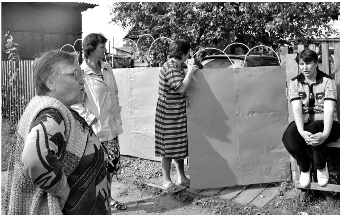
Главное, что заботит дактуйцев – свет и вода.

Ещё не так давно жизнь в Дактуе была ключом. Теперь всё иначе. Деревенские поля и огороды зарастают буйной травой, которую и косить-то уже некому, в подворьях немногочисленная мелкая живность, на всё село не многим более тридцати коровёнок. Село умирает вместе с памятью о когда-то процветающих здесь лесхозах и леспромхозах. И этой безысходностью сегодня наполнена жизнь дактуйцев.