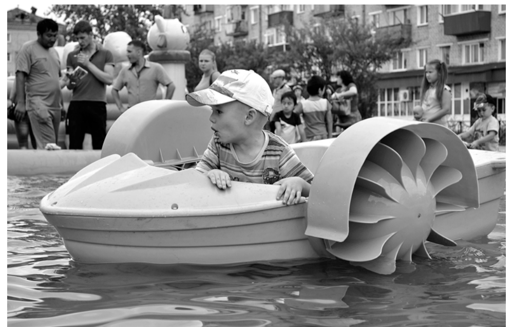
Качнёт весёлая волна, и я плыву туда... сюда...