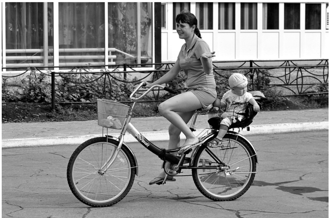
Я уже совсем большой, сижу у мамы за спиной. Эх, прокачусь!