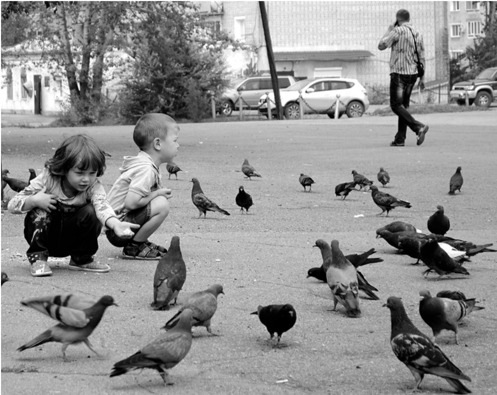
Кормить вечно голодных, воркующих голубей дети готовы с утра и до вечера.