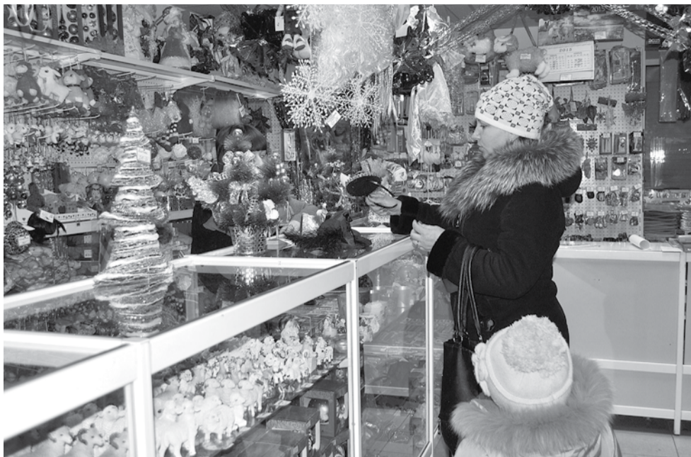
Подарки на любой вкус и цвет.

Площадь районного центра пока пуста. Но, как заверили в поселковой администрации, совсем скоро начнётся монтаж ставших уже традиционным зимним развлечением – горок. Большая будет установлена на площади, у клуба железнодорожников, другая – для самых маленьких – в снежном городке напротив здания районной администрации.