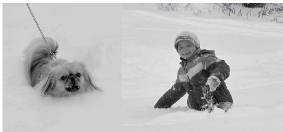
По уши в снегу.