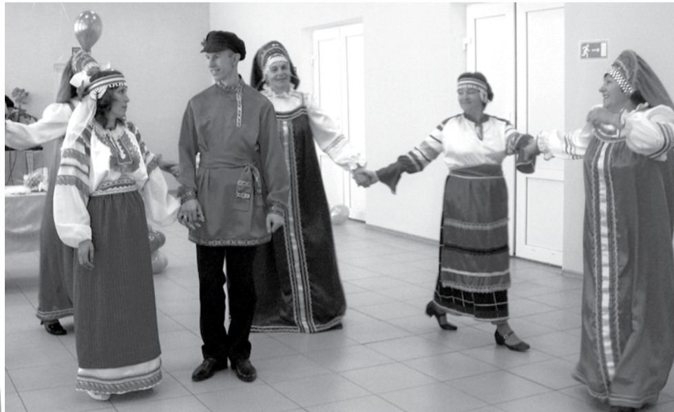
«Песней народной молодых встречайте, да ворота свадебные открывайте!»