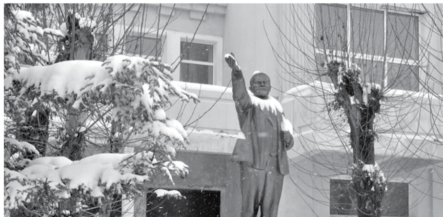
... а дедушке Ленину – белый воротник.