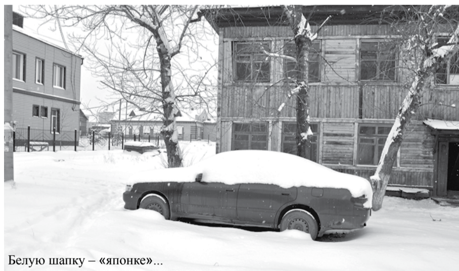
Белую шапку – «японке»...