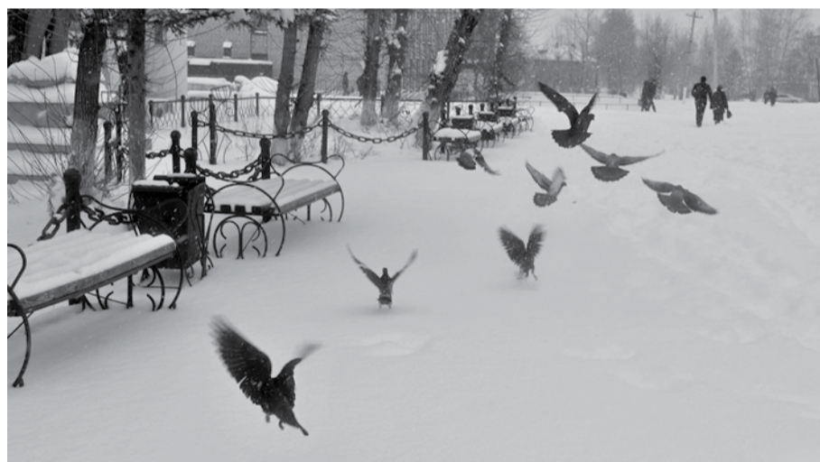
Голубиные пляски на снежном паркете.