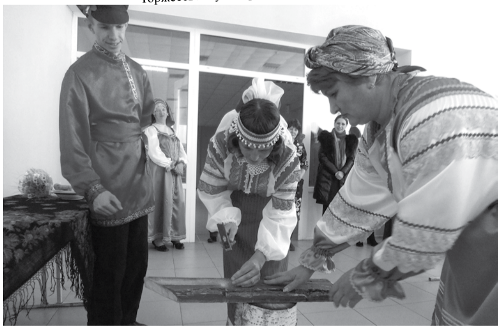
Задание невесте – смастерить полочку.