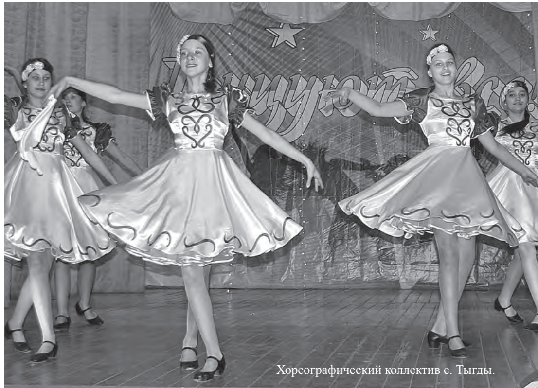
Хореографический коллектив с. Тыгды.

Накануне празднования 70-летия Великой Победы в зале клуба железнодорожников собрались поклонники и ценители танцевальных ритмов. Здесь проходил ежегодный районный фестиваль «Танцуют все».