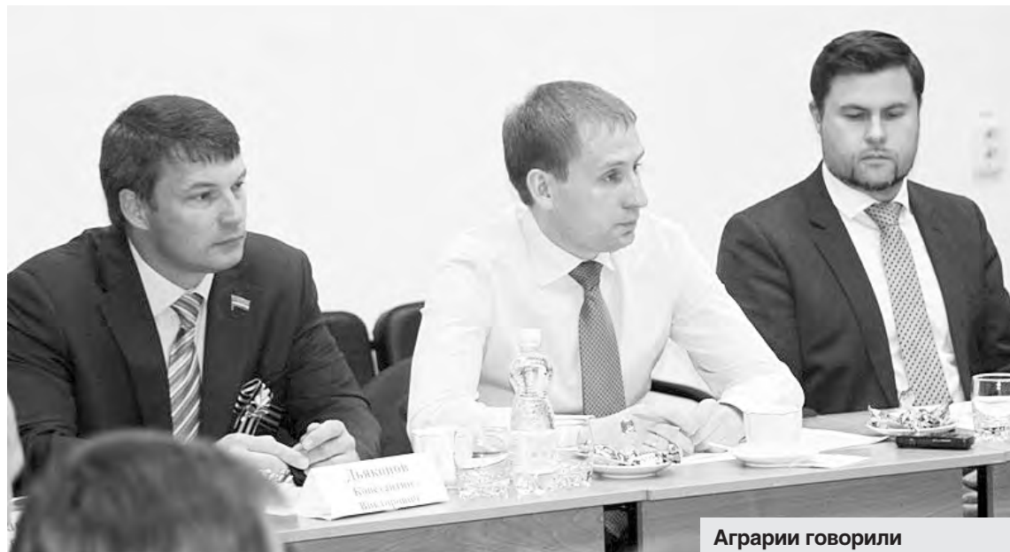
Аграрии говорили о важности строительства элеваторов, дорог и поиска новых рынков сбыта

— Музей ценен для всего Приамурья, — уверен глава региона. — Я знаю, что впереди у сотрудников много интересных планов. Например, создать экспозицию под открытым небом, в которую войдет старинная и современная сельхозтехника. Вообще повод для встречи хороший, гостей приехало много, а значит, и подарков много будет.