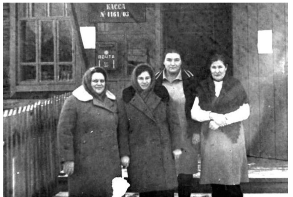
Коллектив почтового отделения села Черняево.