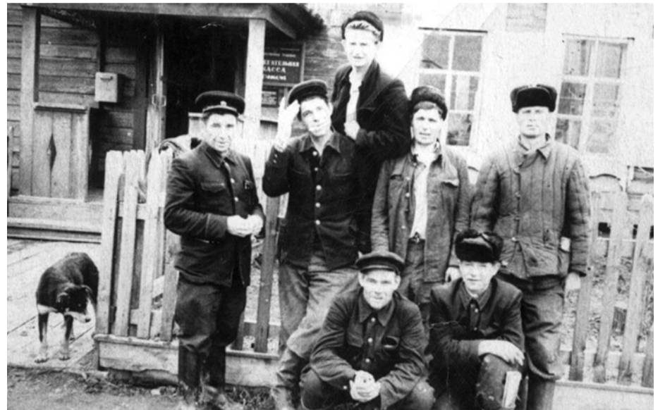
Коллектив Черняевского отделения связи.