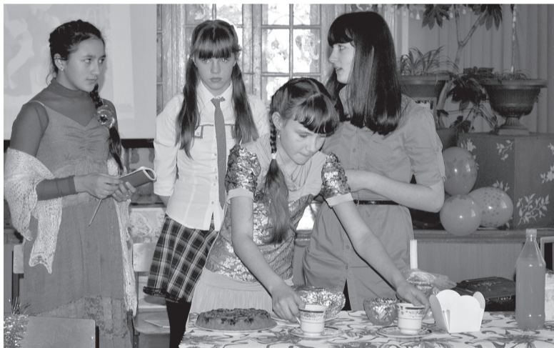
Сивакчане разыграли отрывок пьесы "Джейн Эйер".

Об особенностях английского климата присутствующие услышали от учеников младших классов шко-