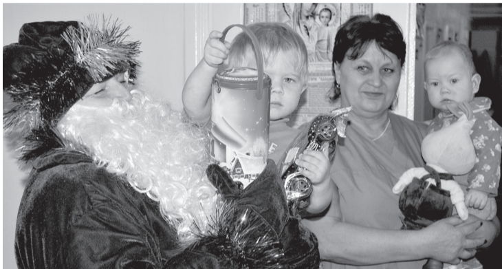
С телевизором и DVD детям вручили сладкие подарки.