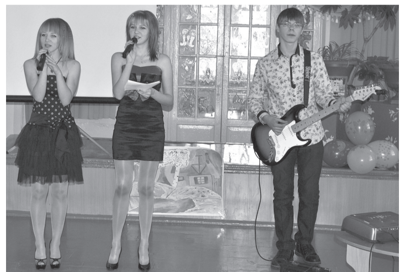
Ушумунцы "зажгли" под электрогитару.