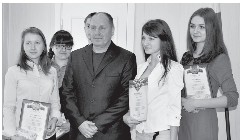
11 выпускников этого года были приглашены на встречу.

Приятным моментом встречи стало награждение участников встречи, выпускников этого года, почетными грамотами и премиями главы района.