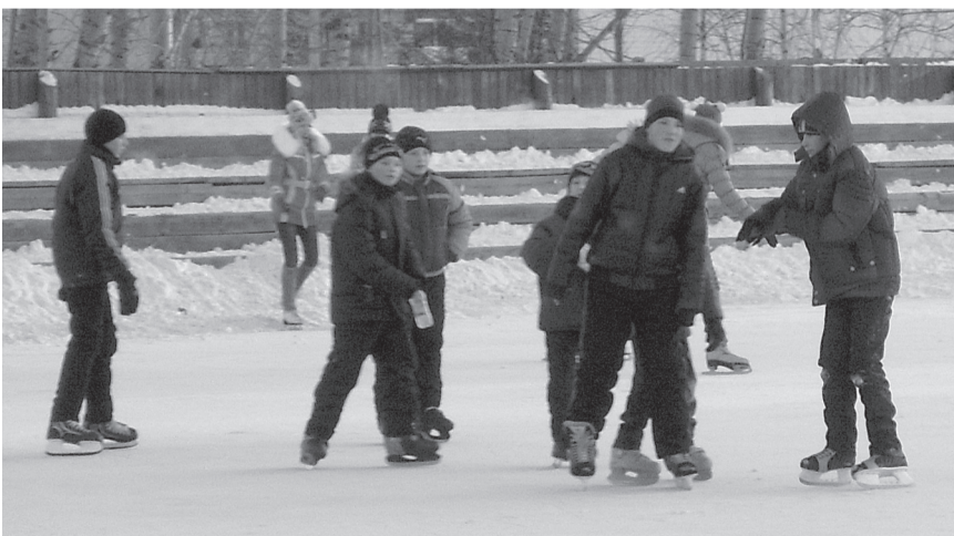
Встаньте дети на коньки!