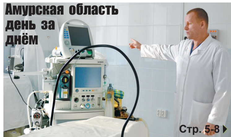
Амурская область день за днём

7 ДЕКАБРЯ 2012 ГОДА № 48 (7749) ПЯТНИЦА Е Ж Е Н Е Д Е Л Ь Н И К