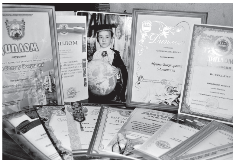
Дети в семье Мотошиных - творческие. Подтверждение этому - огромное количество дипломов и грамот.

Действительно, просматривая толстые портфолио каждого ребенка с огромным количеством