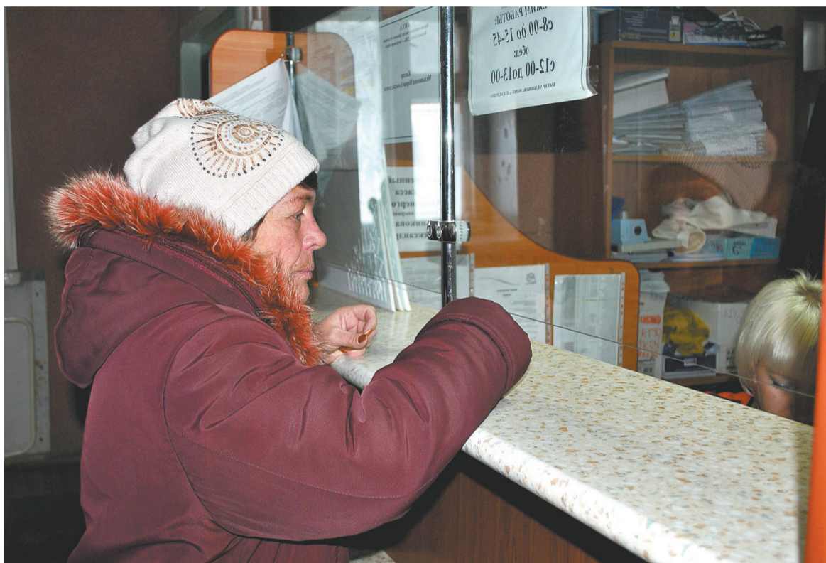
Решение амурских законодателей не нашло понимания у большинства населения.

В 2012 году из 50 миллиардов рублей консолидированного бюджета Приамурья на реализацию социально направленных целевых программ, всевозможные льготные пакеты, выплаты компенсаций и субсидий жителям региона направлено порядка 13 млрд. рублей, то есть 1/4 областной казны. Еще порядка 37 миллиардов израсходовано на содержание социальных учреждений. Согласно Указу президента страны, регионы обязаны по большей части за счет собственных доходов до 2018 года поднять зарплаты всех низкооплачиваемых бюджетников до достойного уровня (зарплаты педагогов школ и дошкольных учреждений, младшего и среднего медперсонала, работников культуры и социальной сферы надо довести до средней заработной платы в регионе). Для этого требуется дополнительные 26 млрд. рублей в бюджет Приамурья. Поэтому и принято такое непопулярное решение, как частичное перераспределение средств со