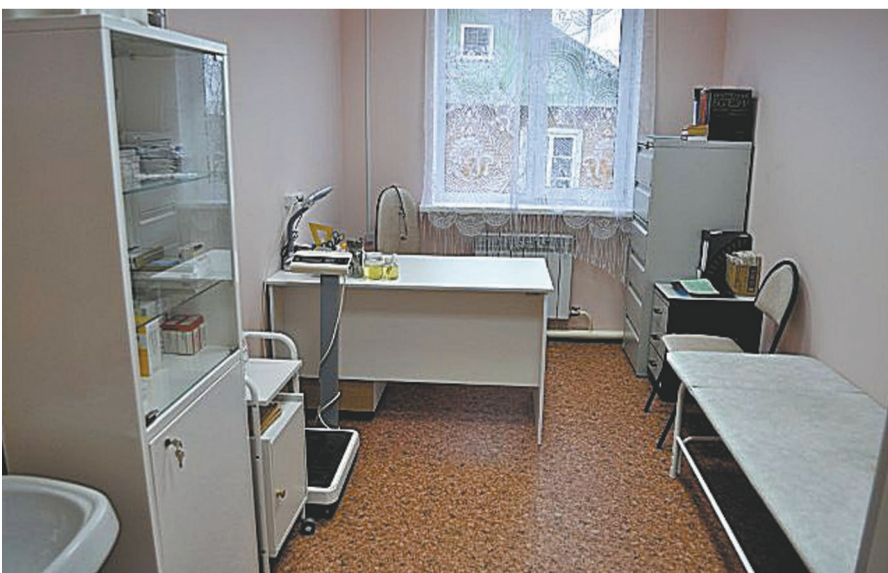
В новом здании у каждого терапевта будет свой отдельный кабинет.

Подходит к завершению строительство нового здания амбулатории в селе Тыгда